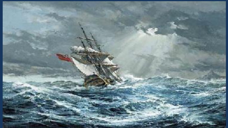
Bounty vor Kap Horn