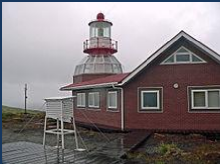
Leuchtturm auf dem Kap Hoorn