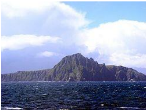
Kap Horn von See aus gesehen