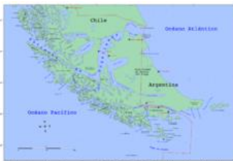
Die Inseln rund um Kap Horn. Die Insel Hoorn (I. Hornos) ist rot markiert.

Kap Hoorn (span. Cabo de Hornos, engl. Cape Horn), dän. Kap Horn, frz. cap Horn, ist eine Landspitze auf der chilenischen Felseninsel Isla Hornos. Kap Hoorn ist, abgesehen von den abgelegenen, noch südlicher gelegenen Diego-Ramirez-Inseln, und ohne Berücksichtigung der manchmal ebenfalls zu Südamerika gerechneten Südsandwichinseln, der südlichste Punkt Südamerikas.