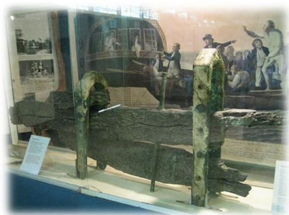
Originalruder der HMAV Bounty im Museum von Suva Fiji