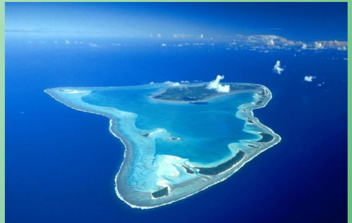
Satellitenbild von Aitutaki