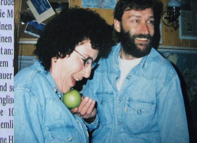
mitglieder des Weinfelder «Bounty- Stellwänden über Geschichte und

Zum Club- unde elde- esel- s von lich inem Die Po eines w ketes beim Von da der «B nahme wurde in die nen üb nau un felden einem cain- Silber nahme der «B zur A strukt die w Schwi