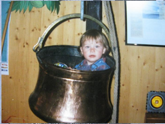
dichten Postbehälter dann aus dem Weinfelder «Bounty Clubs» mo-

airn den win ngel insel leist: nach eine gechts esen des lich, ace- s zu AS » am nicht Pro- stel- des Edwin aus der